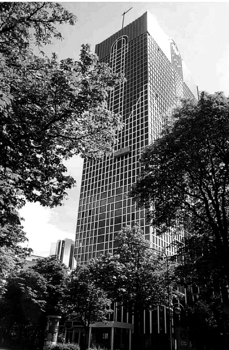
Das Frankfurter Büro Mannheimer Swartlings befindet sich nun in den oberen Etagen dieses Bürohauses mit "Weitblick".